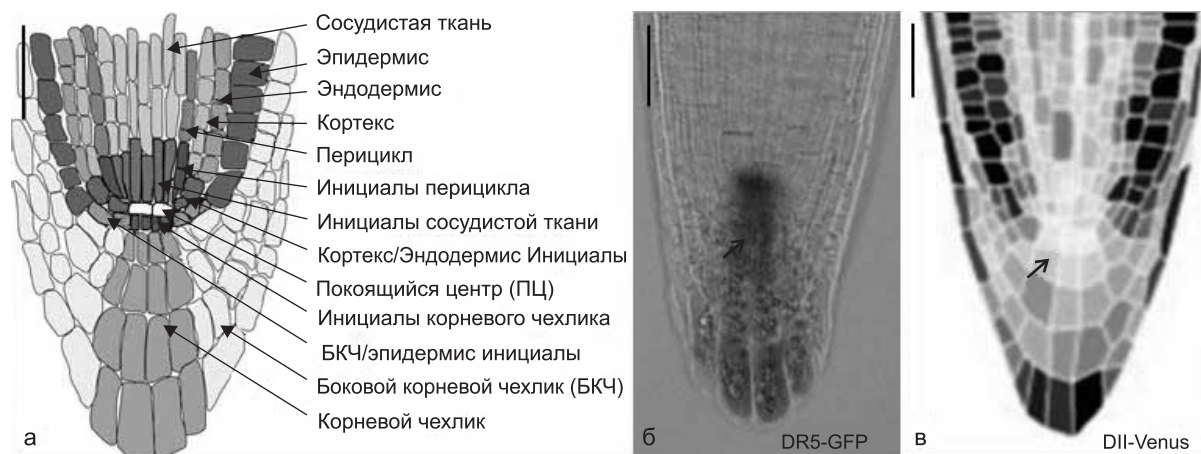
Рис. 1. Анатомическая структура кончика корня A. thaliana и распределение ауксина в нем.

Высокоактивная синтетическая конструкция